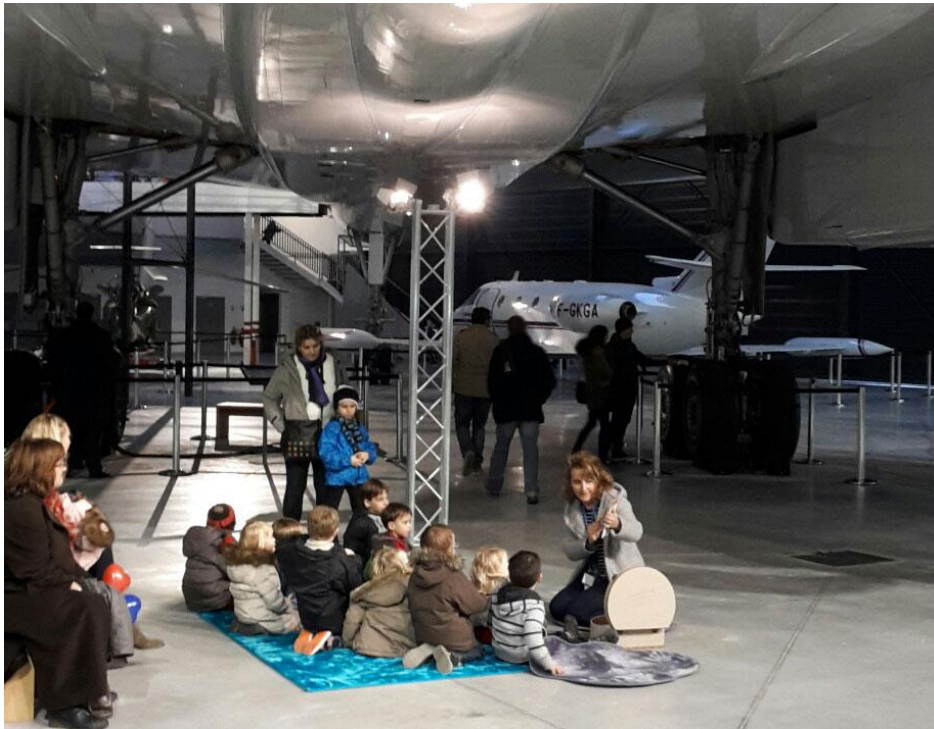
Lecture autour des avions